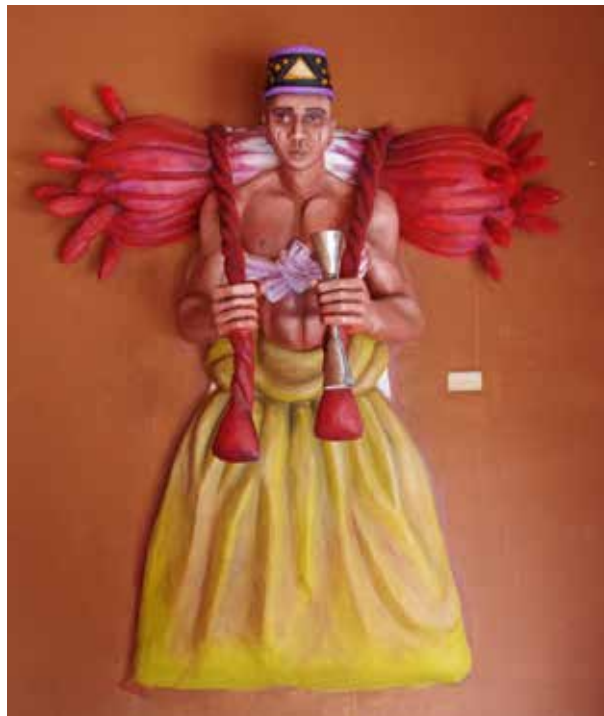
« LE PORTEUR DU VODÛN CHINAN » Haut - relief et Incrustation de pierres

Cette œuvre représente un porteur du vodùn Chinan, homme robuste, torse nu, avec un tissu noué à la hanche, portant la divinité au dos. Ce vodùn se distingue par ses plumes rouges de perroquet, visibles sur les deux bourrelets, et par une traîne blanche centrale tirée par le porteur. Il tient un gong qu'il agite lors des sorties rituelles et des danses sacrées. L'ensemble est soutenu par des cordages fixés à sa poitrine, et il porte un chapeau traditionnel orné d'amulettes.